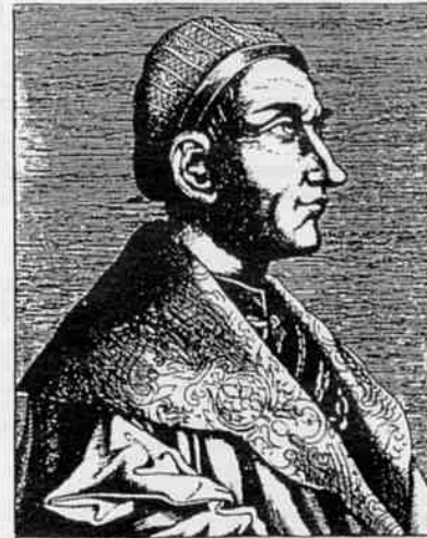
REGINO, CHRONOGRAPHVS O. L. P. ABBAS. PRUMENSIS.